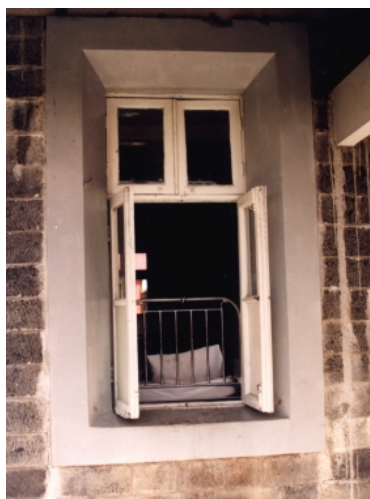
Okno nemocničního pokoje

Byl jsem vyčerpaný a hladový. Probudil jsem se znovu uprostřed noci a celý jsem se chvěl a byl jsem zpocený. Moje srdce bylo plné hrůzy. Ležel jsem tváří obrácený ke stěně. Otočil jsem se, abych se podíval, cože mě to tak děsí. Skrze moji síť proti komárům a skrze železné mříže na okně jsem uviděl oči, možná sedm nebo osm párů očí, které na mě hleděly. Vyzařovaly červená světýlka. Namísto kulatých zornic měly úzké, jako mají kočky. Zdálo se, že jsou napůl lidské a napůl zvířecí. Myslel jsem si: „Co tohle, proboha, jen může být?“ Dívaly se do mých očí a já jsem hleděl do těch jejich, když vtom jsem uslyšel: „Jsi náš, my se vracíme.“ „Ne nevracíte!“ řekl jsem. Chytil jsem svoji baterku a posvítíl jsem na ně. Nic tam nebylo. Ale já vím, že jsem je právě viděl!