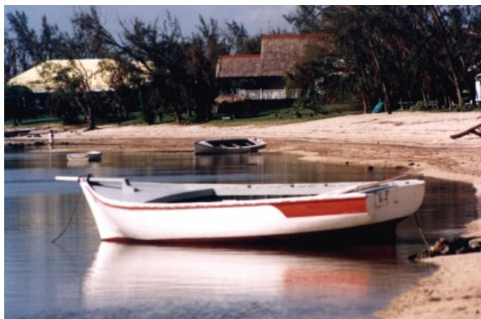
Riviere Noire, místo kde loďka připlula a lan byl ponechán o samotě