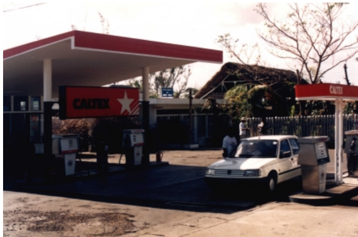
Benzinová pumpa, kde Ian úpěnlivě prosil o svůj život

Tak jsem se snažil znovu se postavit. Belhal jsem se pomalu po silnici, až jsem narazil na několik aut vedle restaurace. Šel jsem k těmto autům a prosil jsem řidiče, aby mě vzali do nemocnice. Muž v autě se na mě podíval a řekl mi: „Kolik nám zaplatíš?“ Kdybyste žili v Asii, pochopili byste, že to je normální. Máte peníze, tak jedete; nemáte peníze, nejedete nikam. Tak jsem řekl nahlas spíše pro sebe: „Nemám žádné peníze.“ Pak jsem si však uvědomil, jak hloupě jsem se zachoval. To jsem neměl říkat. Měl jsem zalhat, ale místo toho jsem řekl pravdu, že nemám peníze. Ti tři řidiči se jen zasmáli: „Jsi opilý, zbláznil ses.“ Otočili se, zapálili si cigaretu a odcházeli ode mne pryč.