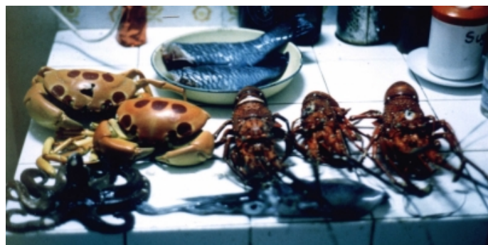
Typická sklizeň z moře

Na tomto ostrově jsem žil v „Tamarin Bay“ (bay = zátoka) mezi místními lovci krabů a surfaři. Přijali mě do svých životů a naučili mě potápět se v noci podél útesů. Noční potápění je úžasná zkušenost. Krabi vylézají v noci a můžete je svojí podvodní baterkou oslepit a velmi jednoduše si je vzít. Ryby v noci spí a tak si můžete vybrat, kterou si dáte k večeři.